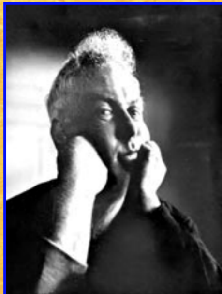
Portrait de Calder / Irving Penn 1947.

Alexander Calder (1898/1976) est un ingénieur en génie mécanique. Né à Philadelphie dans une famille d'artiste, il arrive à Paris le 24 juillet 1926 où, installé à Montparnasse, il attire l'attention de l'avant-garde internationale avec un cirque, une œuvre-spectacle, fabriqué avec des matériaux de récupération. Le Roi du fil de fer développe une production où le vide et le mouvement, la vibration du monde, sont captés. Des formes inspirées du monde animal et végétal.