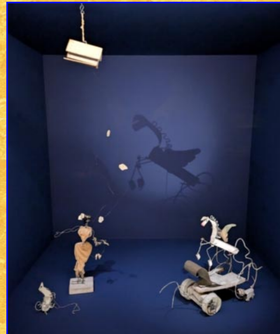
Cirque / œuvre spectacle d'Alexander Calder 1926/1931 Negress, Pegasus, dog and birdhouse with birds.

Editorial, photographies, maquette © Studio Marc Vaye 2026