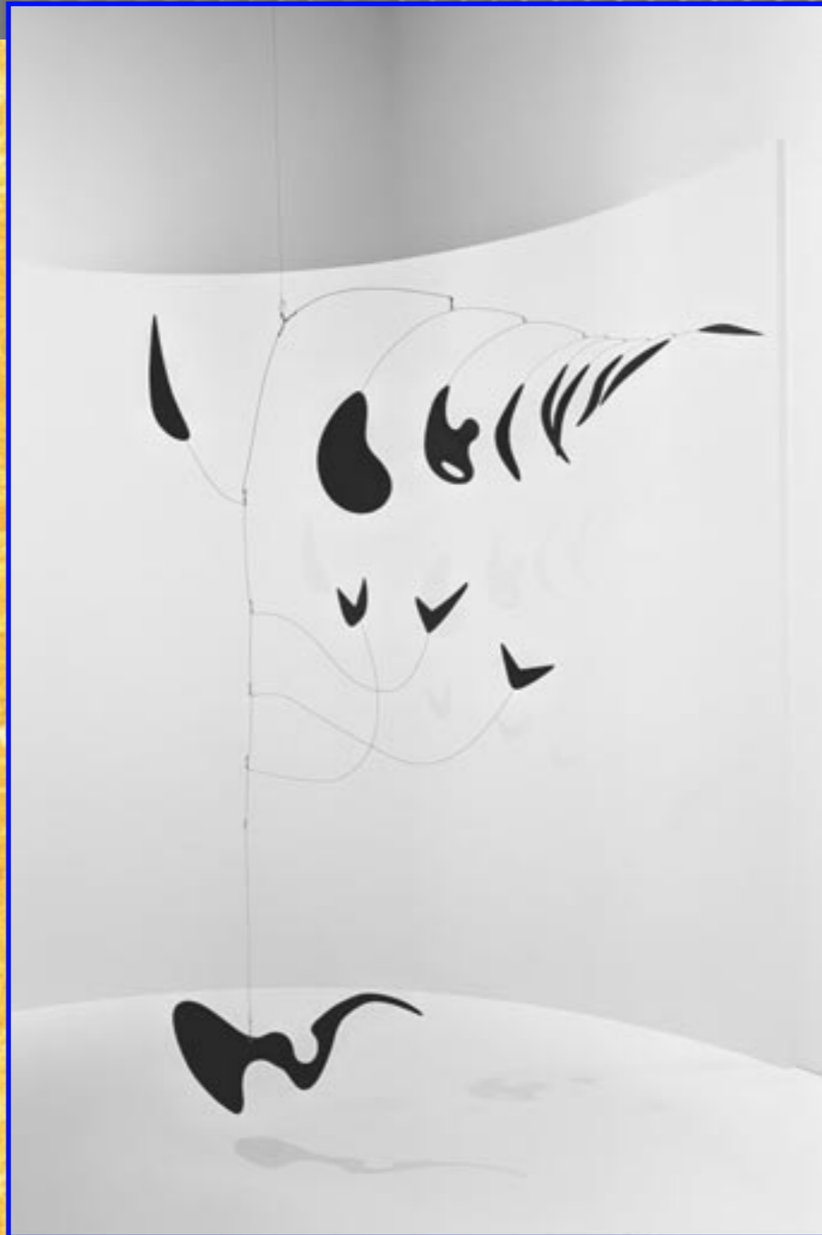
Eucalyptus 1940 / Feuille de métal, fil de fer, peinture.

Ainsi, l'objet demeure toujours à mi-chemin entre la servilité de la statue et l'indépendance des événements naturels; chacune de ses évolutions est une inspiration du moment; on y discerne le thème composé par son auteur, mais il brode dessus mille variations personnelles; c'est un petit air de jazz-hot, unique et éphémère, comme le ciel, comme le matin; si vous l'avez manqué, vous l'avez perdu pour toujours. De la mer, Valéry disait qu'elle est toujours recommencée. Un objet de Calder est pareil à la mer et envoûtant comme elle : toujours recommencée, toujours neuf. Il ne s'agit pas d'y jeter un coup d'œil en passant ; il faut vivre dans son commerce et se fasciner sur lui. Alors l'imagination se réjouit de ces formes pures qui s'échangent, à la fois libres et réglées.